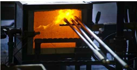
Anlagenbau & Ofenbau