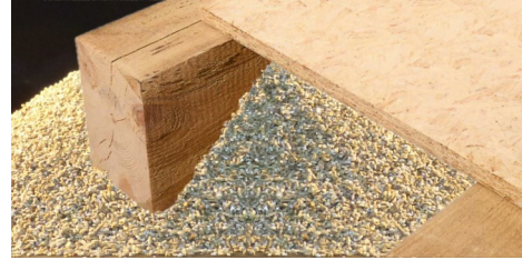
Sanierung & Trockenbau