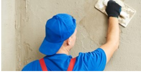
Putz- und Mörtel Industrie